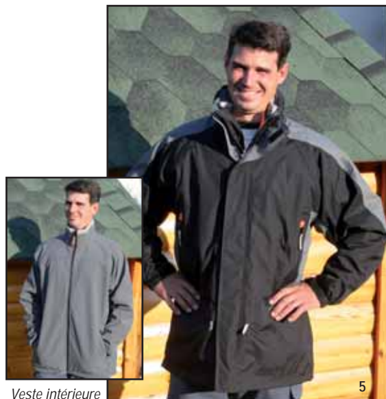
Veste intérieure du parka